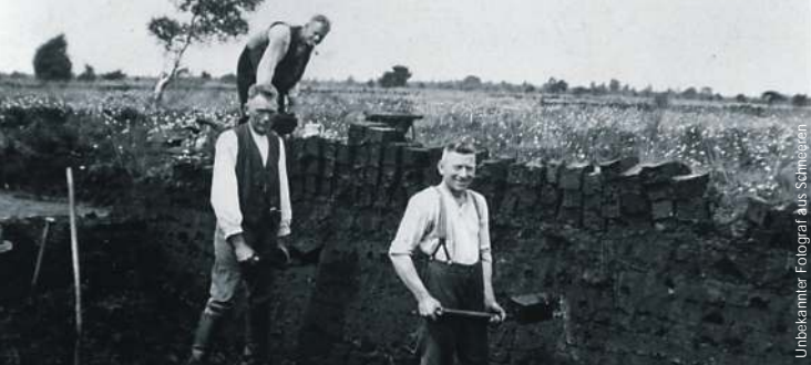
Unbekannter Fotograf aus Schmöggen